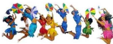
Figura 03: Saltos e gingas

Fonte: Disponível em: http://www.guiadepassagens.com.br/recife/ . Acesso em 25/11/2014.