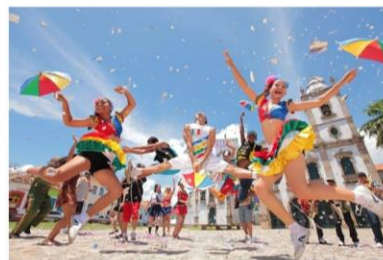
Figura 04: Influência da capoeira em seus movimentos