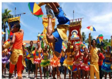
Figura 05: Criatividade das agremiações