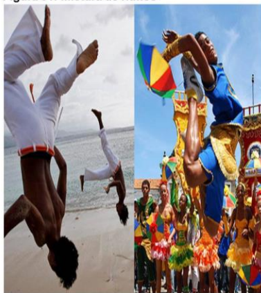
Figura 01: Mistura de ritmos