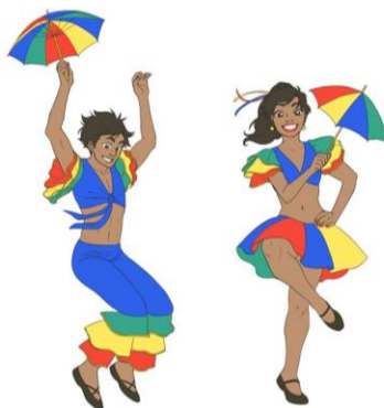
Figura 02: Uso da sombrinha ou guarda-chuva aberto